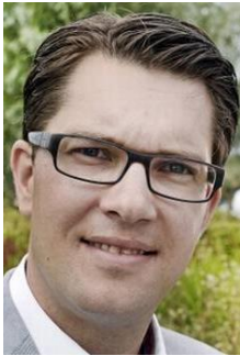
jimmie åkesson er leder

Forfædre: Mange kadre i de nye partier var oplært i nazipartiet Nordiska Rikspartiet. For SD blev udviklingen: Bevar Sverige Svensk, Nationalsocialistisk Front, Folkfronten, Sverige Partiet, Svenskerne Parti