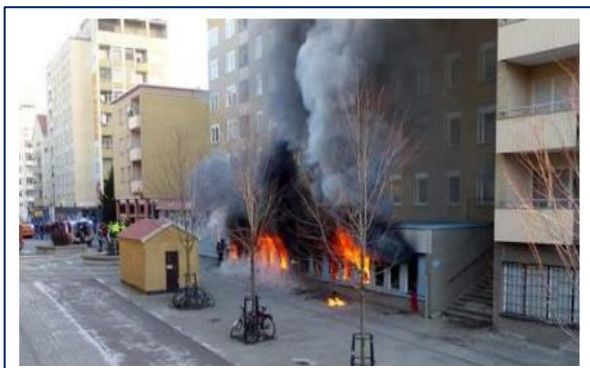
2014 mordbrand ved flygtningeboliger i Eskilstuna

Til Statsministeren: Bander hænger ikke sammen med et stort antal flygtninge og indvandrere, hvor de end måtte komme fra. Banderne er et socialt og politisk fænomen, der som oftest er sexistisk, racistisk og nationat selvforherligende. Banderetorikken kan og skal ikke anvendes til at imødekomme ekstrem nationalisme og bane vejen for øget diskrimination.