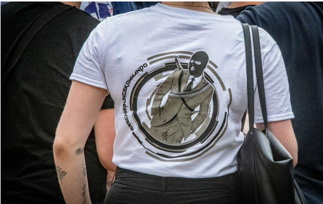
Yderligere en deltager ved remigrationsdemonstrationen den 29.7. 23. Tekst på T-shirten: Erschiessungskommando (Skudhold eller eksekutionskommando)

Demonstrationen bar præg af, at en del deltagere bar nazistiske symboler og tegn, som er forbudte i både Østrig og Tyskland. Som f.eks. tatoveringen ndst..