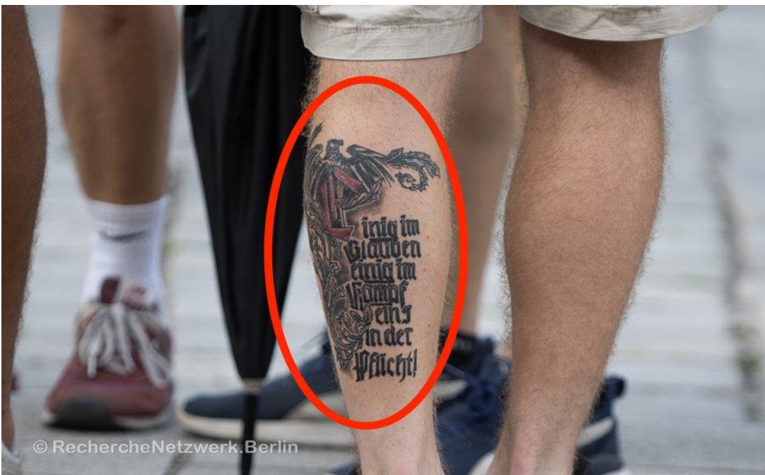
NSDAP Wochenspruch: Einig im Glauben, einig im Kampf, einig in der Pflicht. (Enig i troen, enig i kampen, enig i pligten). Vægaviser, som NSDAP offentliggjorde mellem 1937 og 1944 med citater fra kendte nazi-ledere.

Demonstrationen bar præg af, at en del deltagere bar nazistiske symboler og tegn, som er forbudte i både Østrig og Tyskland. Som f.eks. tatoveringen ndst..