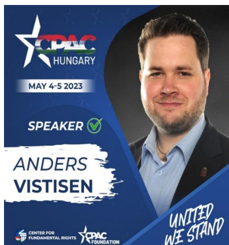
Danish Mep, The Opponent of Gender Propaganda

Fra dansk side deltog Anders Vistisen , medlem af EU-parlamentet for Dansk Folkeparti.